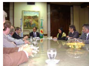
Scioli pidió incluir en la mesa forestal el tema social y el aporte del sector al cambio climático.